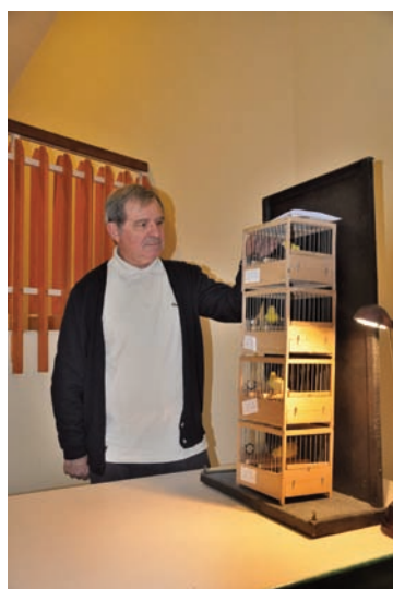
Le stam de chanteurs est placé en colonne.

Certains éleveurs l'utilisent ; personnellement, je ne le fais pas, mais on peut voir une différence car les oiseaux se mettront plus facilement à chanter s'ils sont dans les mêmes conditions qu'à l'entraînement.